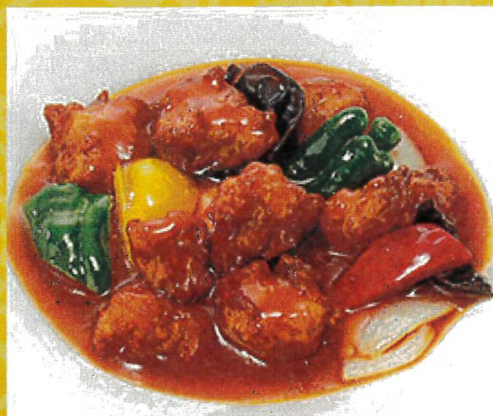
2303 宝華風酢豚 1,090円 2390 ハーフ酢豚 690円