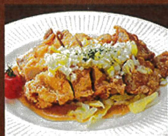
2380 油淋鶏 890円