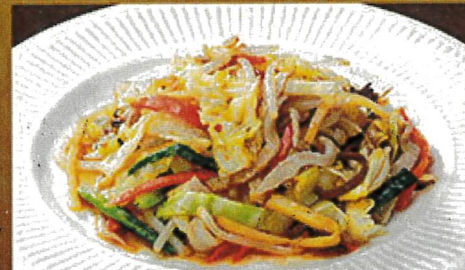
2258 シヤキシヤキ野菜炒め 790円 2259 ハーフ野菜炒め 590円