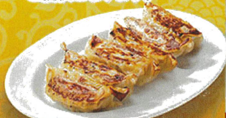
2264 焼き餃子(6ヶ) 530円 2270 ハーフ餃子 330円