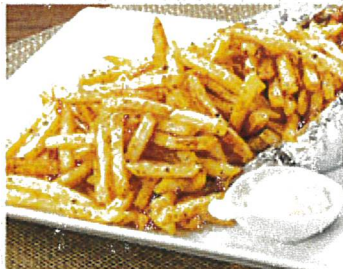
2540 ハイパーケイジャン メガ盛りポテト 790円