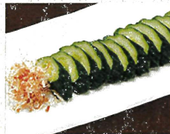
2197 胡瓜ぬか漬 390円