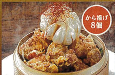
2052 にんにくから揚げ ピラミッド 990円