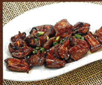
2319 焼きもつ 630円

● 混雑時や、料理内容によってはお時間をいただく場合がございます。● 料金はすべて税込です。 ● お料理内容は季節によって変わることがあります。● アレルギー対応については行っておりません。