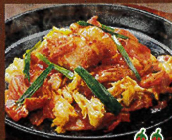
2267 ブタキム玉子炒め 690円