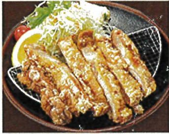
2053 信州山賊焼き 990円