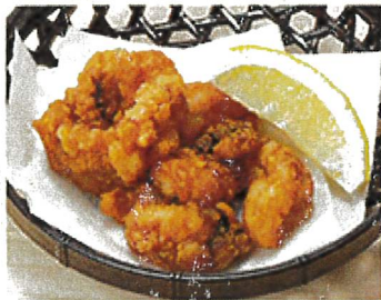
2111 タコ唐揚げ 630円