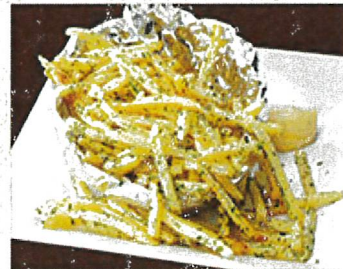
8689 のりしお 山盛りポテト 790円