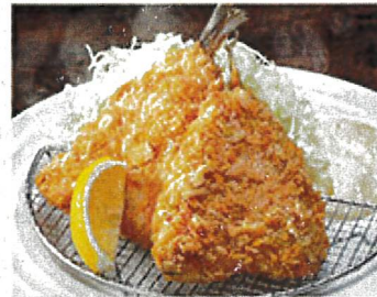
8673 タルタルアジフライ 790円