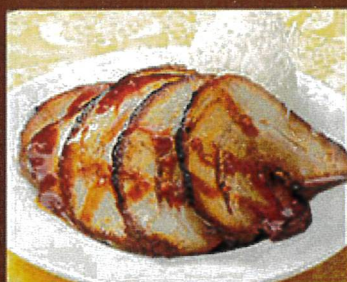
2279 自家製おつまみ ネギチャーシュー 590円