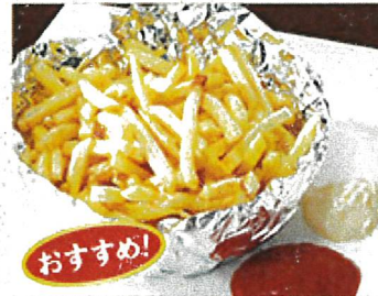
8682 おすすめ! 山盛りディップ ポテトフライ 590円