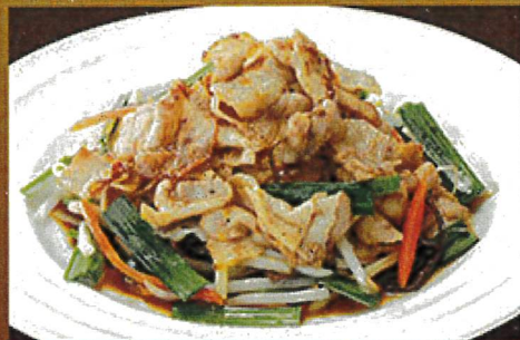
8693 肉ニラ炒め 890円 8694 ハーフ肉ニラ炒め 590円