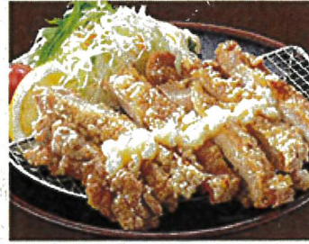
2044 にんにくたっぷり 信州山賊焼き 990円