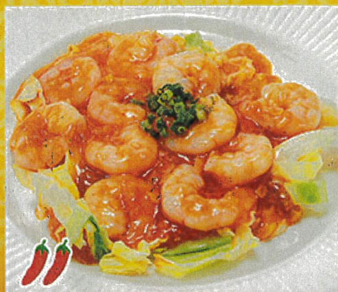
2313 海老のチリソース 990円 2281 ハーフ海老チリ 690円