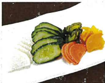
2003 漬もの盛り合わせ 540円