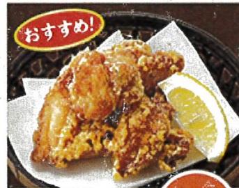
2161 おすすめ! 特製山梨風 から揚げ 590円