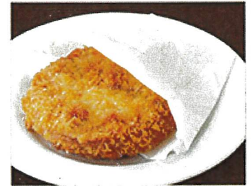
8675 ハムカツ 230円