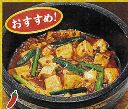
2266 ほどよい辛さの マーボー豆腐 990円