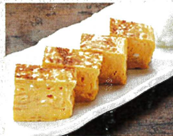
2064 手づくり明野産の 玉子焼き 490円