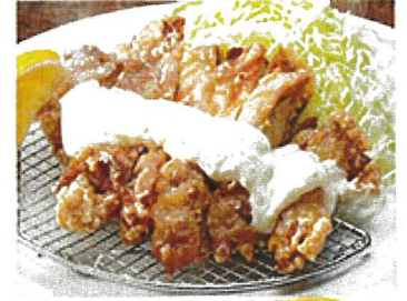
8671 おすすめ! タルタル山賊焼き 990円