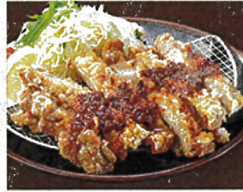
2045 地獄辛!! 信州山賊焼き 990円