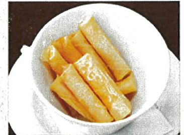
8674 スティック チーズ揚げ 690円